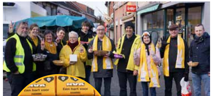
Op Valentijnsdag deelde N-VA Hamme chocolaatjes uit.