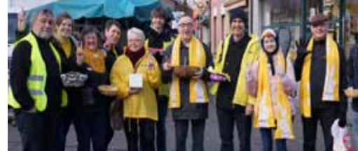
N-VA heeft een hart voor Hamme (p. 3)