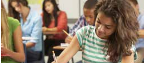
N-VA vraagt onthaalklassen taalontwikkeling (p. 2)