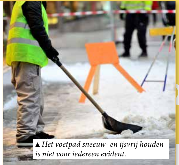
▲ Het voetpad sneeuw- en ijsvrij houden is niet voor iedereen evident.

Een gemeentelijke ploeg mogelijks bestaande uit vrijwilligers, wijkwerkers, leefloners en gemeentepersoneel kan dan de nodige hulp bieden. De schepen van Openbare Werken toonde duidelijk zijn waardering voor het initiatief, maar een heleboel praktische bezwaren verhinderden het om deze winter al van start te gaan. Er is, volgens de schepen, veel onderzoek nodig om dit te kunnen realiseren.