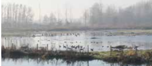
Wandelen in overstromingsgebied Kastel p. 2