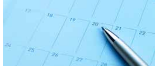
Noteer alvast in uw agenda p. 3